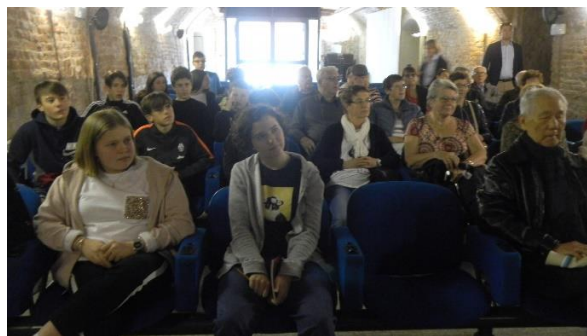
Rencontre entre le groupe de séniors fontenaysiens et les collégiens qui deux années auparavant, ont contribué à la réalisation du livre « Paroles d'enfants pour la Paix »