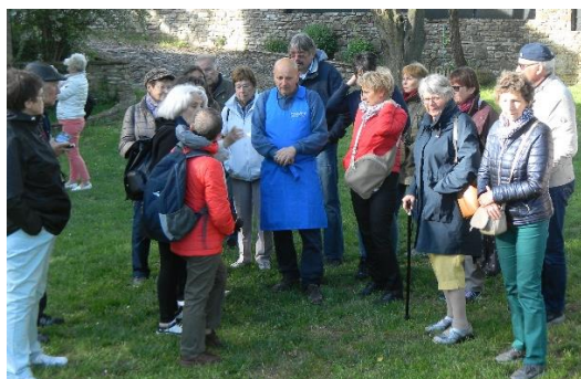
Entre autres visites, celle d'un vieux moulin à eau réhabilité